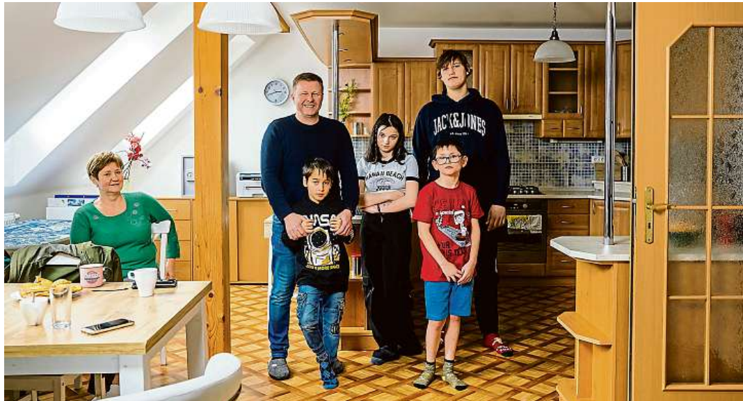
Dobry příklad Děti z dětského domova v Dolní Čermné žijí s vychovatelem v samostatném bytě. Na noc tam dochází „noční teta“. Chystaný zákon chce bydlení v takovém stylu zavádět i jinde.

Podle Miloslava Macely, poradce ministra práce a koordinátora této legislativní změny, by připravovaný zákon ještě v tomto roce mohla na stůl dostat vláda. „Cílem není jenom modernizovat zařízení a snížit kapacity dětských domovů, ale pře-