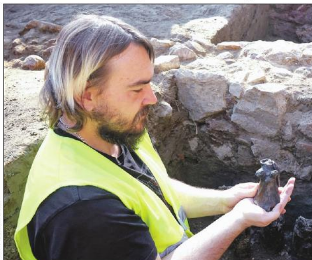
Při vykopávkách v Brně se našla středověká konvička zachycující muže, a to buď rytíře, nebo mnicha.

Postava na konvičce je oděna do dlouhého splývavého šatu. Za hlavou má kápi, kterou se dovnitř nalévala voda. V levé ruce drží figurína oválný štít a v pravé ruce zčásti ulomené kopí. Přestože zachycuje muže ve zbroji, může jít nejen o rytíře, ale i mnicha.